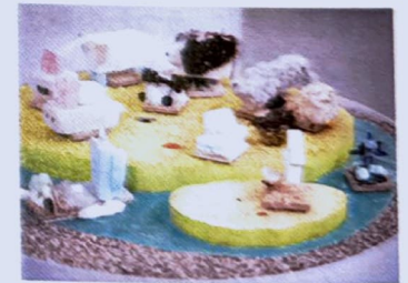
50人の子どもと3人の大人、3人のアーティストによる「想像上の生き物」が生息地別に展示。