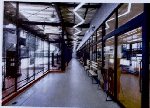
2021年にリニューアルした、明るく気持ちのいい店内。